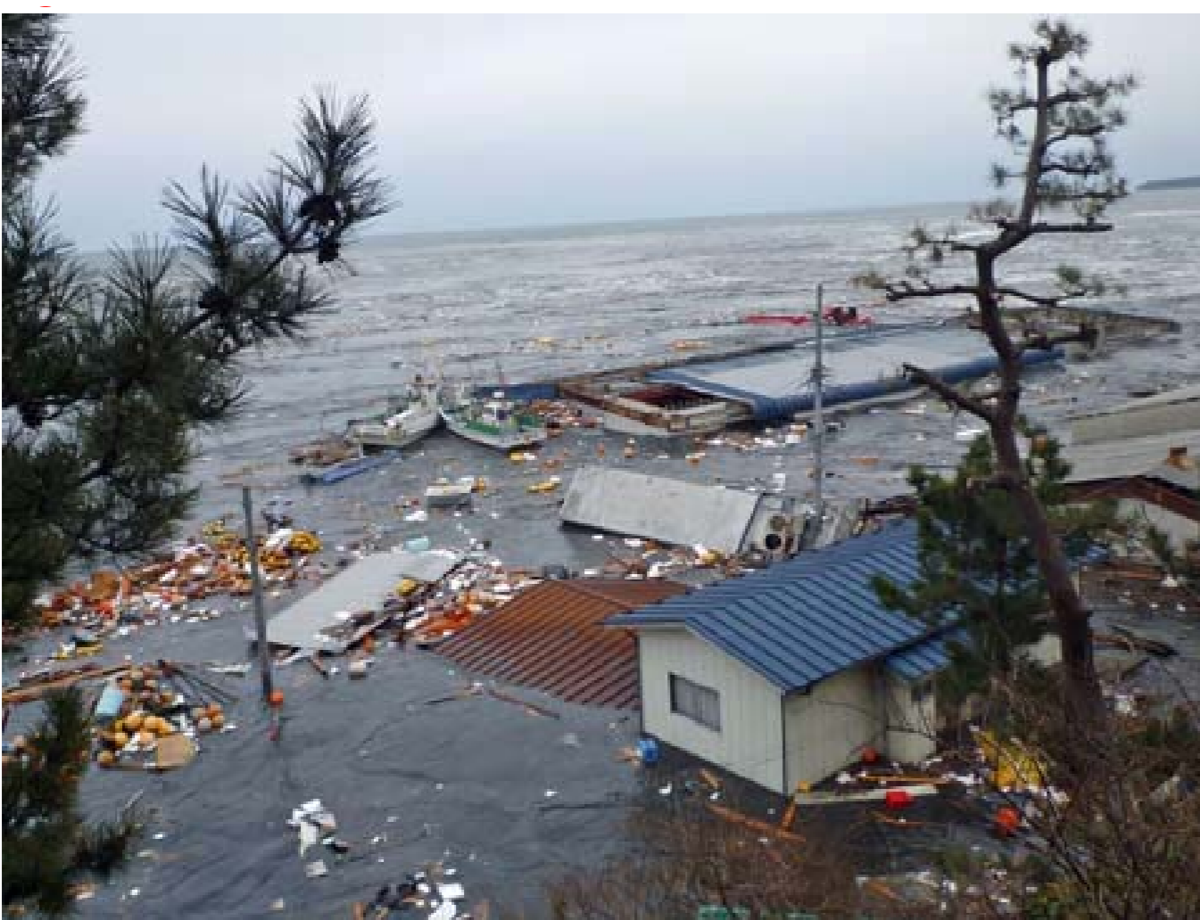
種市漁協に第3波が来襲、屋根まで浸水。撮H23.3.11