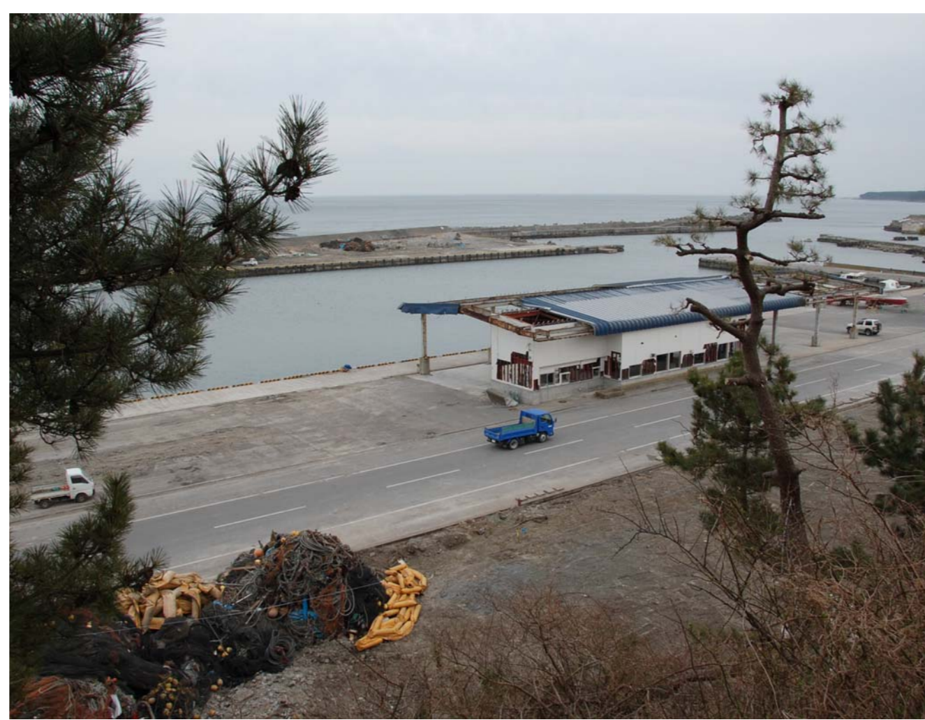
津波来襲後の種市漁協 撮H23.4.7