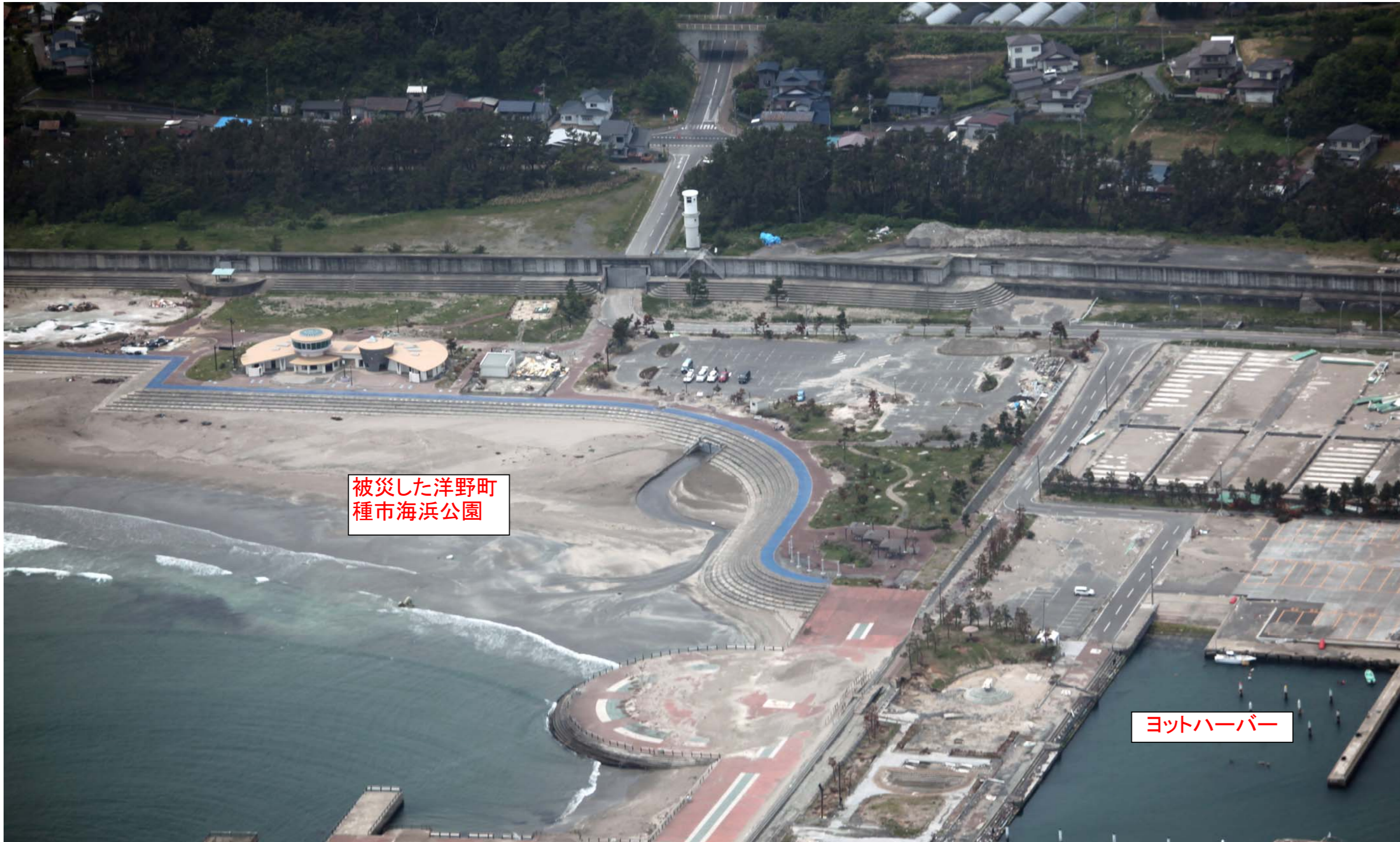
被災した洋野町 種市海浜公園

平成23年3月11日に発生したマグニチュード9.0の東北地方太平洋沖地震により岩手県内の沿岸地域では甚大な被害が発生、種市漁港の津波最大遡上高さは9.43mに達した。