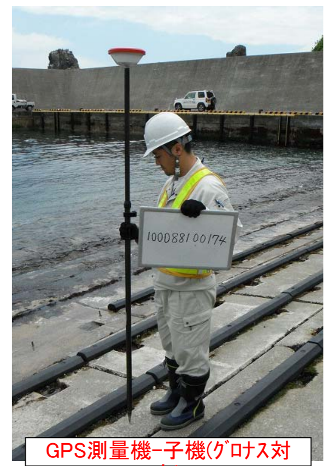
GPS測量機-子機(クロス対)